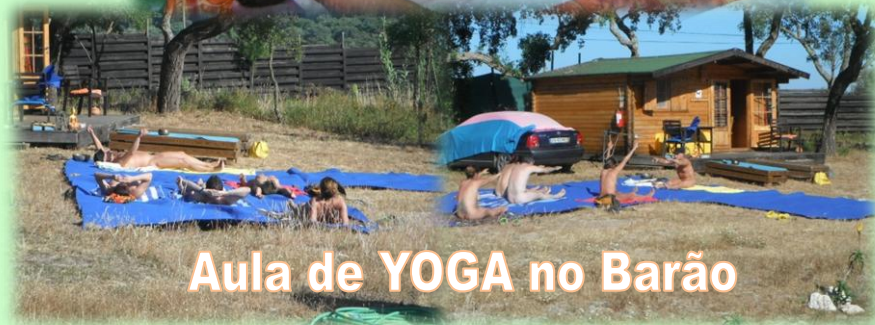
Aula de YOGA no Barão