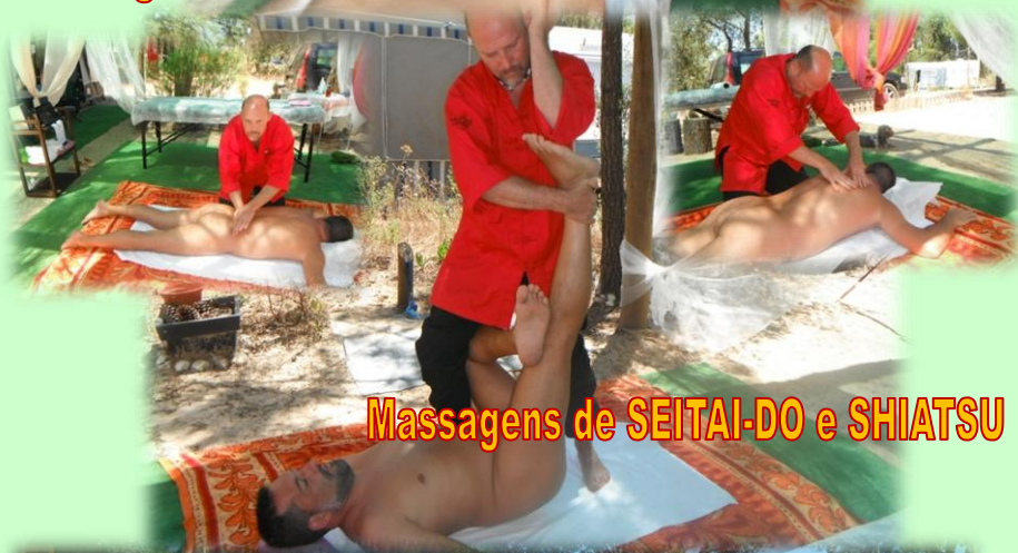
Massagens de SEITAI-DO e SHIATSU