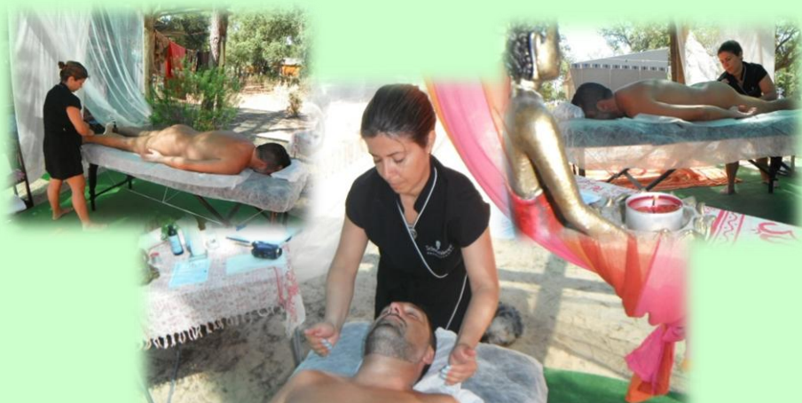
Massagens de relaxamento