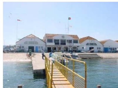
Vista do Restaurante

O preço é de 10 € por pessoa (adulto) e de 6 € por criança (até 9 anos). Nele está incluído o referido rodízio, as bebidas (vinho da casa, sumos, refrigerantes, água e café), o pão, a salada e a sobremesa. Exceptuam-se os vinhos especiais, aperitivos, digestivos e qualquer outro extra, que deverão ser pagos à parte.