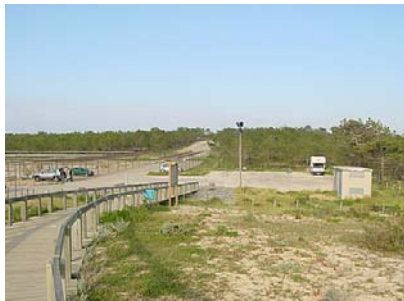
Parque de estacionamento na Comporta

Pelas 13:00 horas os participantes sairão da praia para se dirigirem a Setúbal, fazendo a travessia por barco em Tróia, para se reunirem no Restaurante “Âncora Azul” no Clube Naval Setubalense, com vista sobre o Sado, onde, a partir das 14:30/15:00 horas, será degustado um “Rodízio de Peixe” (à discrição, entre uma variedade que poderá incluir sardinha, carapau, sargo, sargueta, choupa, chôco, robalo, dourada, salmão, cavala, salmonete, etc., conforme a oferta do dia).