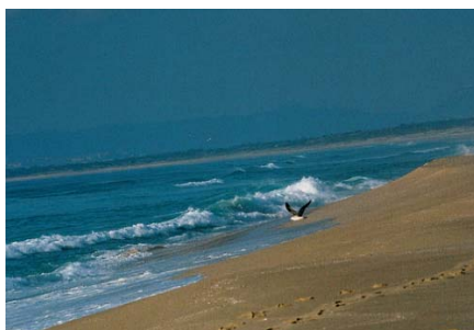
Praia da Comporta (sul)